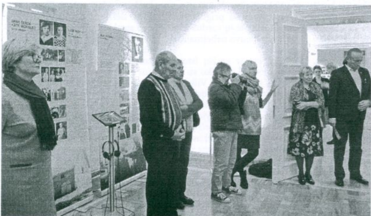
Parodos pristatymas Žemaičių dailės muziejuje.

Ši skaudžius vaikų likimus atskleidžianti paroda bus eksponuojama iki sausio 6 dienos.